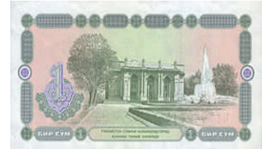
紙幣に描かれている日本人が建設に関わったナヴォイ劇場

「海外引揚がつないだご縁」を東京オリンピック・パラリンピックにつなげようと「ホストタウン」に登録されました。